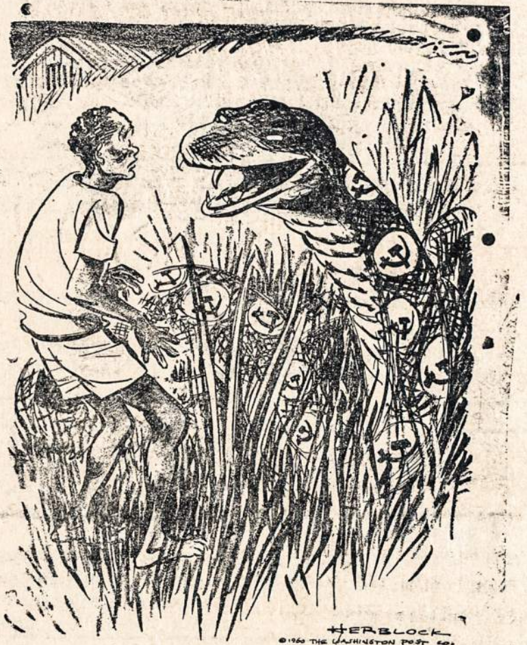
Komunizmas Afrikoje: «Aš norėčiau Afrikos tautas apginti,» (USIS)

— Vilniaus radijo žiniomis, Lietuvoje jau šiemet numatoma statyti naują — daug didesnę negu Klaipėdoje — celiuliozės ir popierio kombinatą. Į visasąj. popierio ir ce