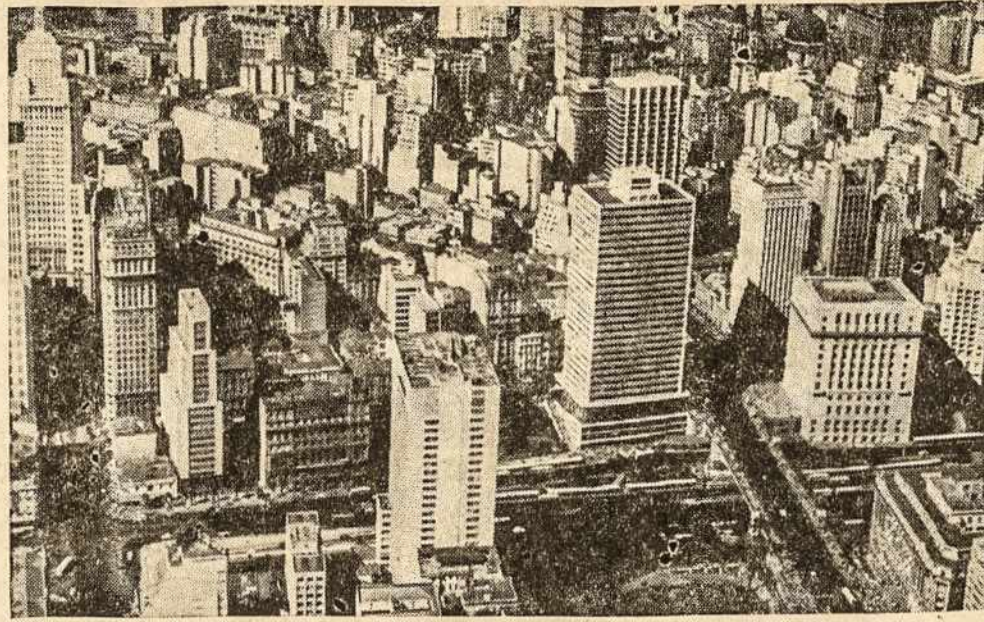
São Paulo, miesto vaizdas

Sovietai 1956 metais už importuotus iš Vakarų kviečius sumokėjo po 6230 dol. už to-