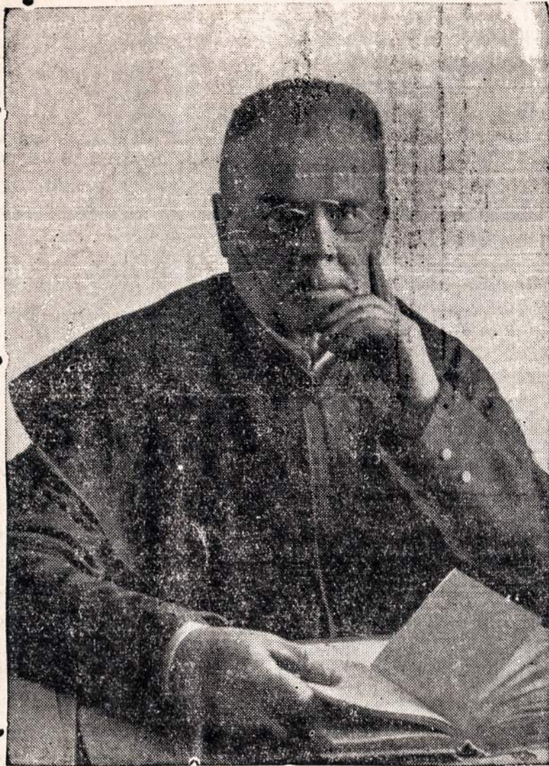
Maironis — Jonas Mačiulis

Dabarties ateizmas nebėra tik deologija. Yra taip pat fizinė jėga. Jos ramsčiu ir varikliu pasidaręs rusiškasis bolševizmas grūmoja pasauliui didelės valstybės galia. Pastangos jai atsis, ir ti yra taip pat atremtos daugiau į politinę ir karinę jėgą, negu į krikščionišką pasaulėžiūrą. Abejose pusėse, nors jas dalo geležinė kovos siena, yra bendrų susilietimo taškų. Mūsų ideologas St. Šalkauskis taip apibūdino, kaip «dechristianizacijos linkmę, paimtą tiek buržuazinio,