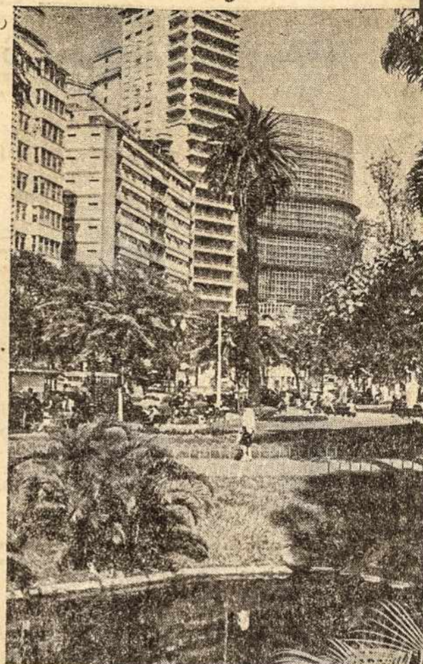
São Paulo miesto dangoraižiai.

ilgomis, 1495 kilociklų bangomis, kiekvieną sekmadienį devintą 21) val. vakaro. Per radijo galima pasveikinti gimtadienio, vardadienio vestuvių ir kitomis progomis. Radijui laiškus siųsti šiuo adresu: caixa postal 4118, São Paulo. Fone: 63-5975.