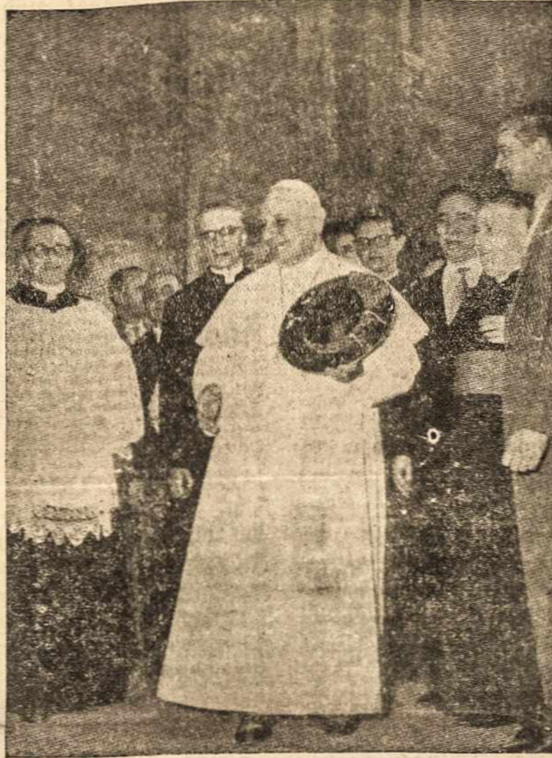
POPIEŽIUS JONAS 23-ČIAS Audiencijos metu Vatikane

Birželio mėn. 3 d. po keturių dienų sunkios agonijos mirė Popiežius JONAS 23-čias, pragyvenęs šiame pasaulyje 81 metus ir 6 mėnesius. Popiežiumi buvo pus metų.