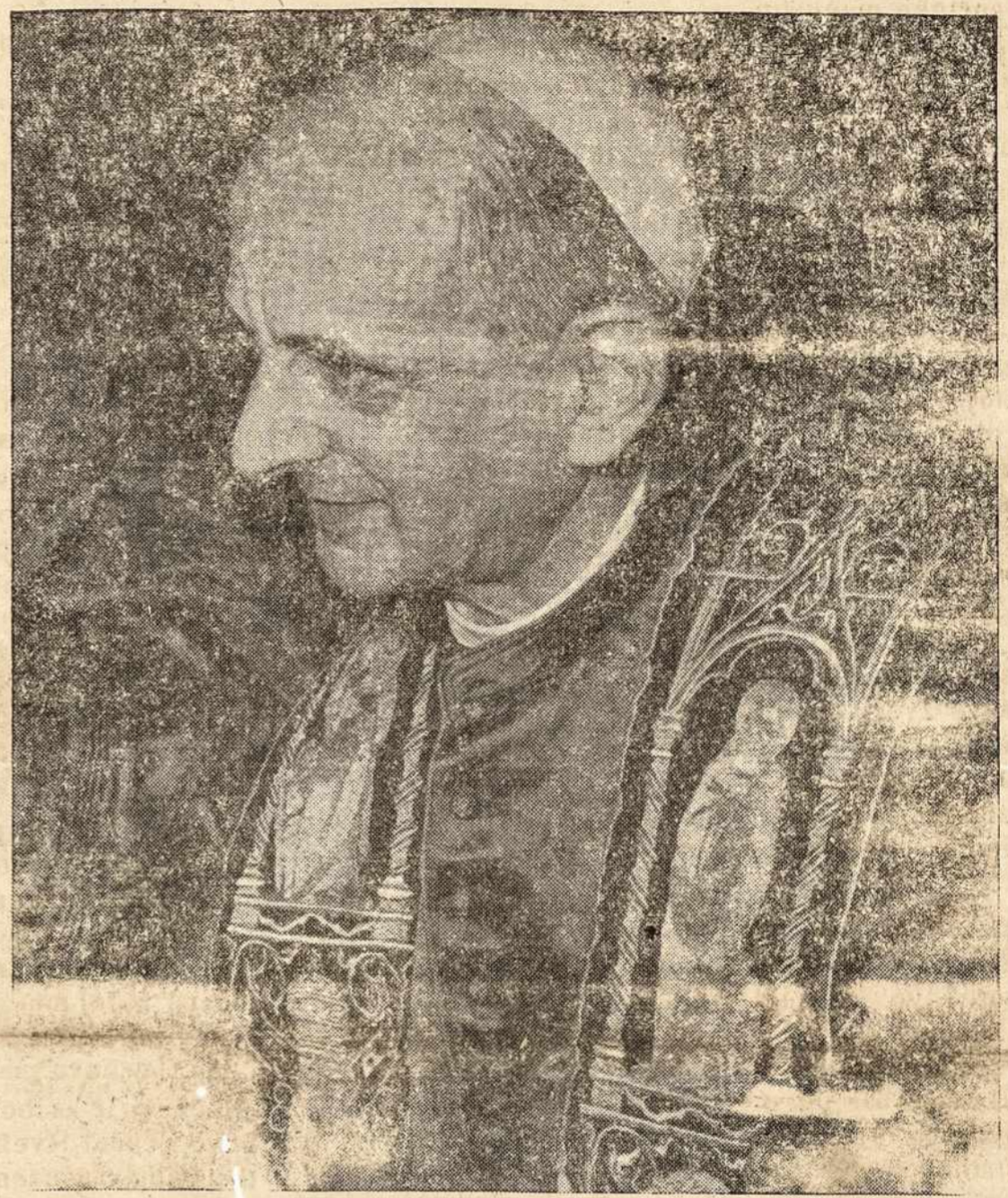
POP JŪZUS POVILAS ŠEŠTASIS, kaip Vatikano šlokeniai praneša, ruošia katalikiškam pasauliui atgalą encikliką apie moderniojo pasaulio santykius su religija. Šis enciklikos laukiana su dideliu susidomėjimu.

Okeanijoje kom. partijos la (tęsimas 6 pusl.)