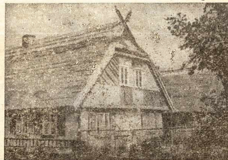
Laisvos Lietuvos ūkininko gyvenamas namas

Vengrijoje įstaigos jaunimui rodančios daugiau pakantot ir tai ypač ryšku po 1956 m. sukilimo. Režimas deda įvairias pastangas jaunimą sudominti sovietine sistema. Pagal oficialius pranešimus Vengrijoje jaunimo nusikaltamumas kiek sumažėjęs.