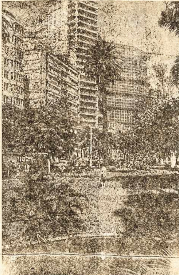
Šo Paulo miesto vaizdas.

Šiuos visus nenormalius laikotarpius pergyvena kiekviena nauja tauta. Jų ir Brazilija negalėjo išvengti. Yra rimtai pagrįstos vilties ir sąlygos kas kart darosi vis pa-