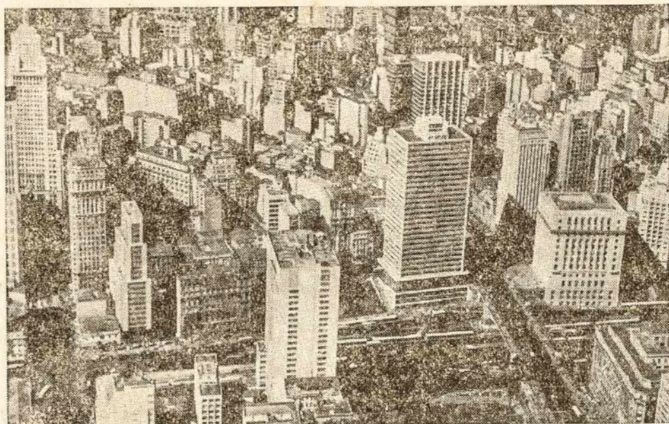
Sāo Paulo miesto vaizkas.

SKAITYKITE IR PLATINKITE VIENTELI PIETŲ AMERIKOS SAVAITRAŠTI «MŪSŲ LIETUVA».