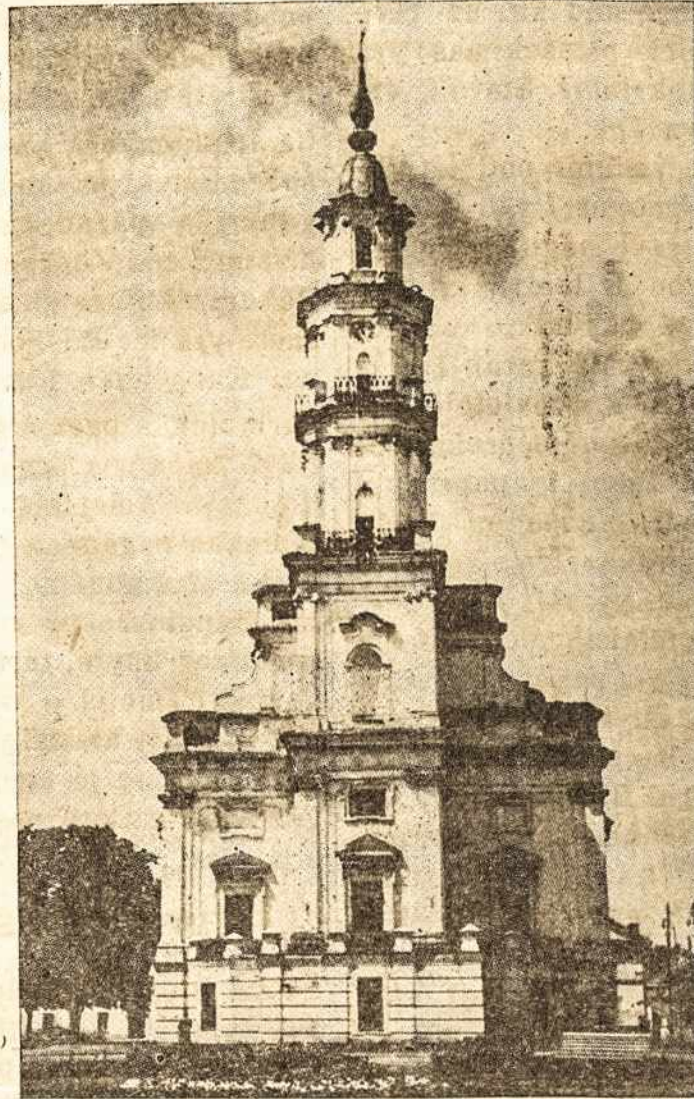
Kaunas — l otušės rūmai.

Desta forma você quer chamar a atenção dos que o cercam, quer proclamar a altas vozes o aparecimento de uma