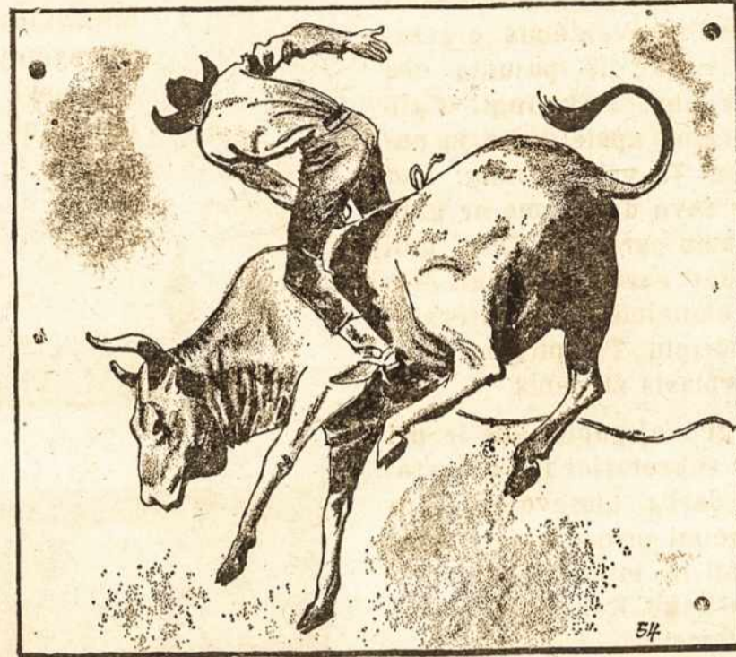
RODEIO: EMOÇÃO, CORAGEM E PERÍCIA

O rodeio é um dos mais populares esportes nos Estados Unidos, atraindo enormes multidões. A maioria das provas de rodeio são derivadas das tarefas desempenhadas pelos «cowboys». Nas cinco provas que compõem um rodeio, os vaqueiros cavalgam no dorso bú do animal chucro, não sendo permitido nem o uso de rédeas. Apenas numa prova com animal mal não domado o vaqueiro pode usar sela e cabresto. Noutra, o «cowboy» segura-se apenas numa corda passada pela cintura do animal. Nas