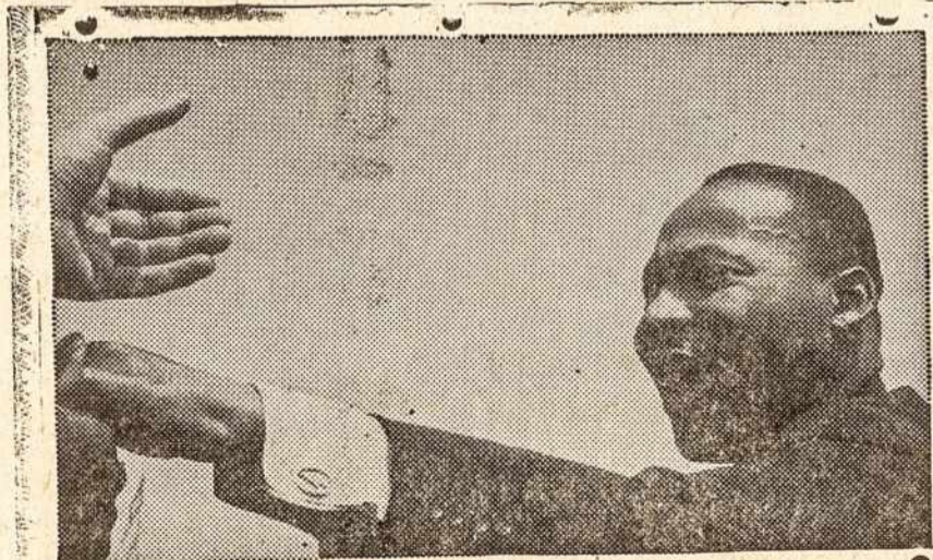
Kun. dr. Martin Luther King, Š. Amerikos juodu kū įtakingiausias kovotojas. Apdovanotas Nobelio premija.

LIETUVI, dalyvauk pirmoje Sās Paulo Lietuviu Alaus Šventėje!