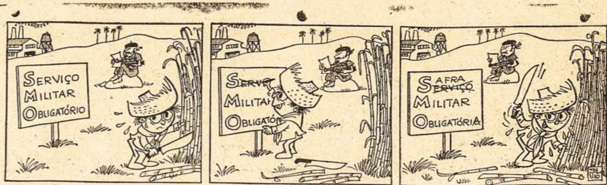
USIS: Privalomas karinis cukraus nuėmimas.