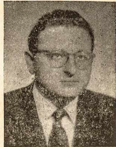
PONAS MEČYS PALECKIS ŠIO «M.L.» NR. GARBĖS LEIDĖJAS

Anglijos karalienė Elzbieta II ji laukėsi Vakarų Vokietijoje, kur buvo sutikta su didžiausiu entuziazmu ir reikšmingomis iškilėmis. Karalienė aplankė įvairius Vakarų Vokietijos miestus, kurių tarpe taip pat ir Vakarų srities Berlyną.