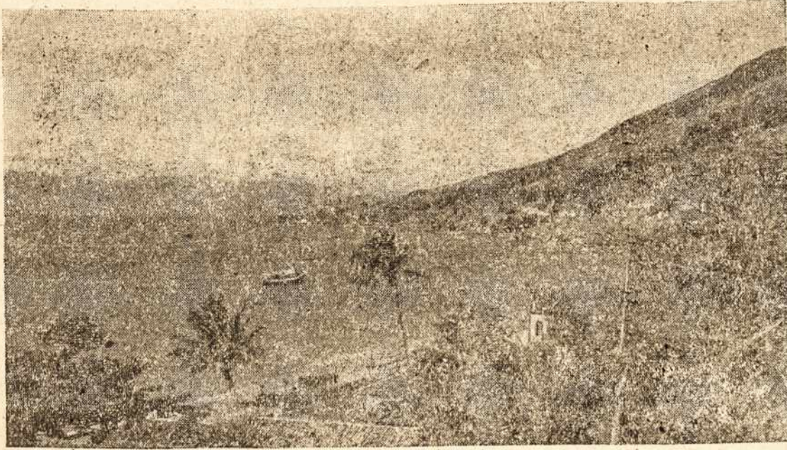
Vienas iš gražių «Iha Bela» vaizdų.

LIETUVIŲ BŪVYČAVLA ZELINA: Rua Inacio ir Av. Zelina, Mons. Pio Ragažins kas, Tel. 63-5975.