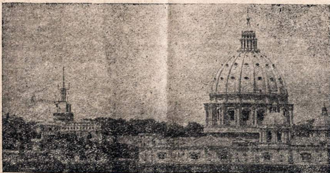
Brangiausi istoriniai Vilniaus paminklai

Sveikindami jį šia proga, prašome Aukščiausiojo, kad Jis lydėtų jį, jo darbus ir Lietuvą.