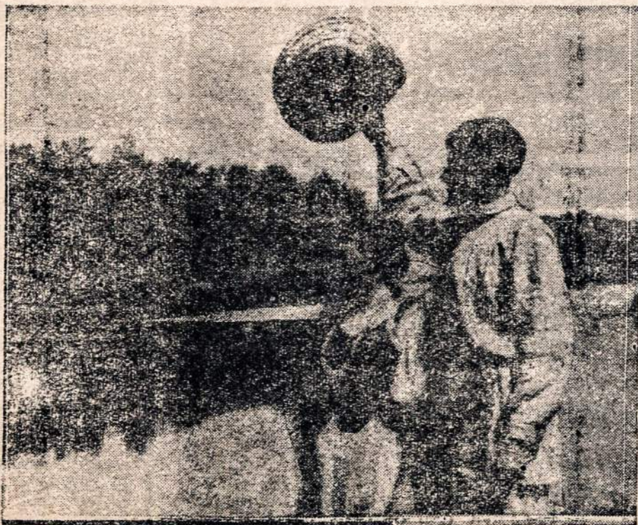
Laisvos Lietuvos jaunimas