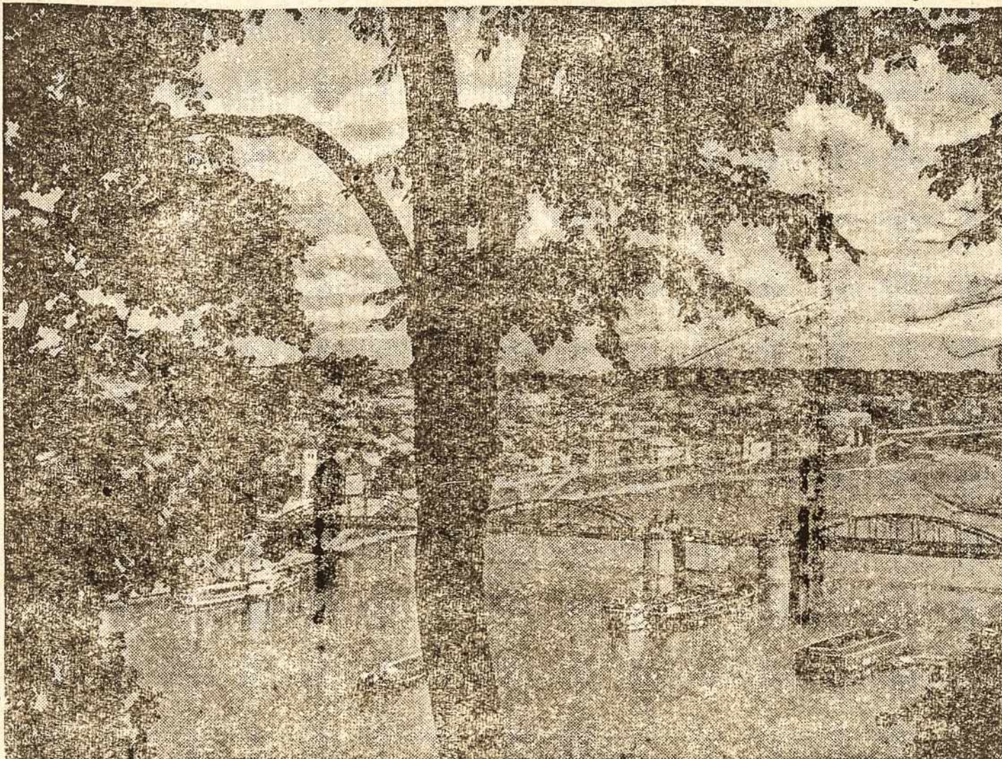
Gražus Kauno miesto vaizdas