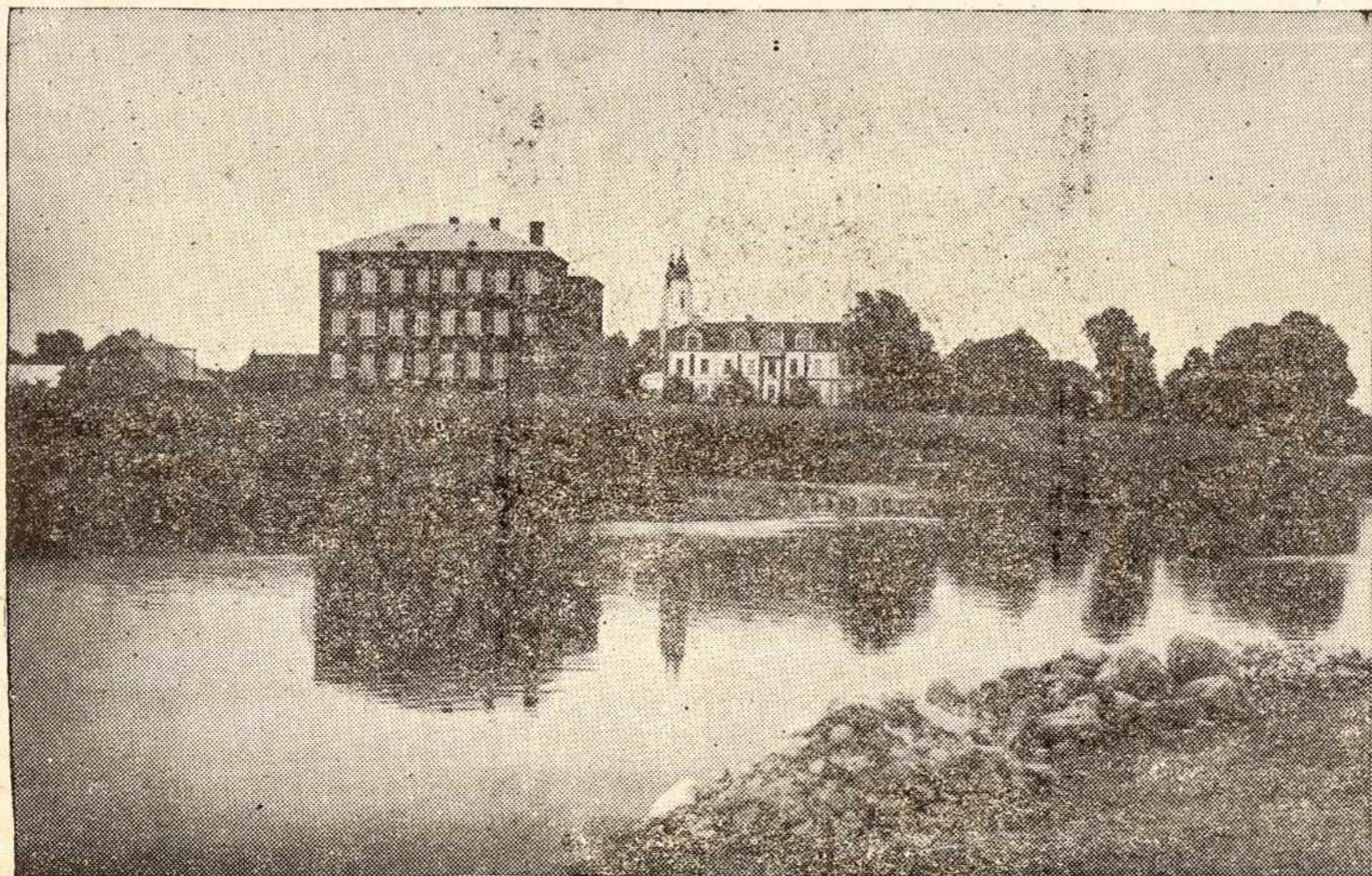
Vievas iš daugelio gražiųjų Lietuvos vaizdėliu.