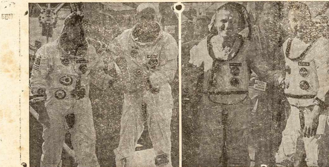
LINKS AIEJ! KELIAUTOJAI — Kosmonautai Šiaurės Amerikiečiai, kurie pirmieji su sitiko erdvėje 15 d. gruodžio 1965 m. Dešinėje James Lovell ir Frank Borman, kairėje Thomas Stafford ir Walter Schirra. Pirmieji išbuvo erdvėje 14 ka dienų, antrieji 26 valan das, 4 valandas skridę vieni ne oli kitę.

Sydney arkivyskupas kard. Gilroy spalio 16 aplankė šv. Kazimiero Kolegiją Romoje. Kaip žinoma, kolegijos svečių namuose per bažnyčios susi rinkimo sesijas, šalia 10 kitų vyskupų, gyveno keturi Aus tralijos ganytojai.