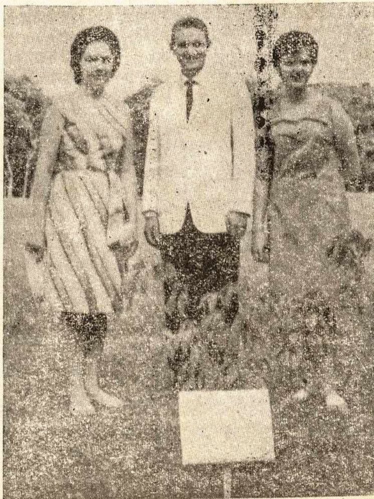
Nuotraukoje matome tris S. Paulo lietuvius jaunuolius.

Be spaudos yra S-goje ir kitų visa eilė «varbių» klausimų ir reikalų, dėl kurių turėtų pasisakyti ir kiti jos nariai, kuriems rūpi tos organizacijos ir bendrai lietuviškos veiklos ateitis.