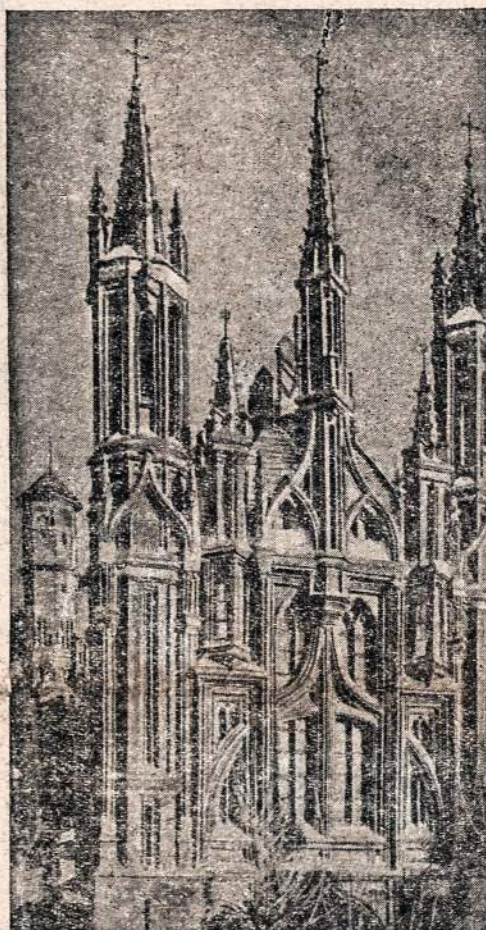
LIETUVOS GOTIKAS. Vilniaus Sv. Onos Bažnyčia, kurią Napoleonas, jei būtų galėjęs, tai ant savo delno būtų ją perkėles į Paryžių.

Turguje kalbėjau su lietuviu kaimo moterėle. Jos pasakojo, kad Druskininkų (Nukelta į 5 pusl.)