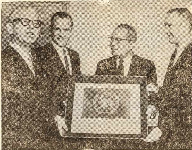
Dr. U. Thant Jungtinių Tautų organizacijos sekretorius gauna dovaną vėliavą kurią nešė savo kšėnėje astronautas Edward White, kai jis «valdė» erdvėje išėjęs iš erdvėlaivo.

Ele respondeu severamente: «Se você comete uma infração de tráfego, tem de pagar por ela». Depois acrescentou amavelmente: «Você é quase da idade de meu filho. Ele morreu o mês pas-