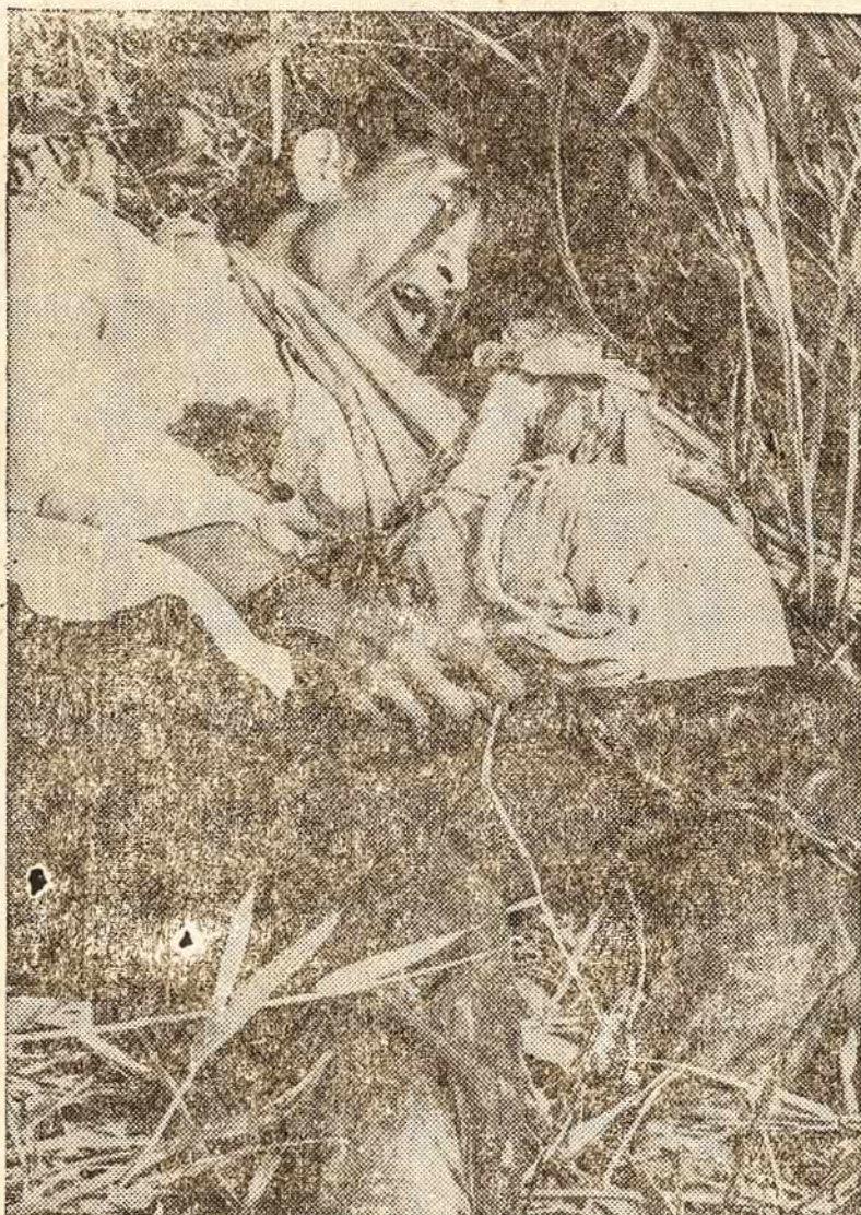
KARAS IR JO BAISENYBES

Netolimaime kaime aklas, šimto metų senelis pradėjo pasakoti kad netoli apsišveikimo vietos prieš 80 metų stovėjusi katalikų bažnyčia, kuri sudegusi, o jos vietoj esanti užkasta geležinė skry-