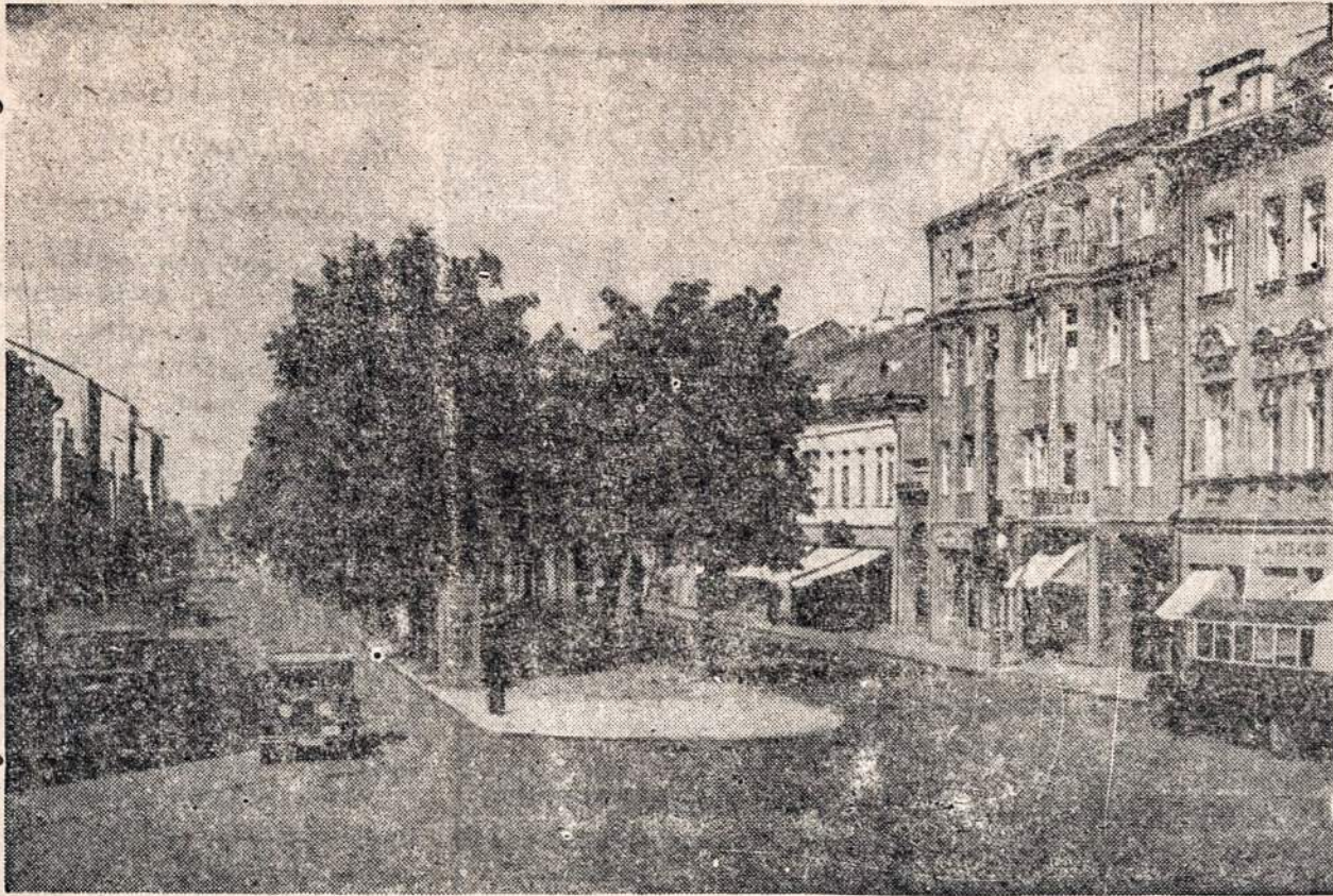
Kaunas — miesto vaizdas.