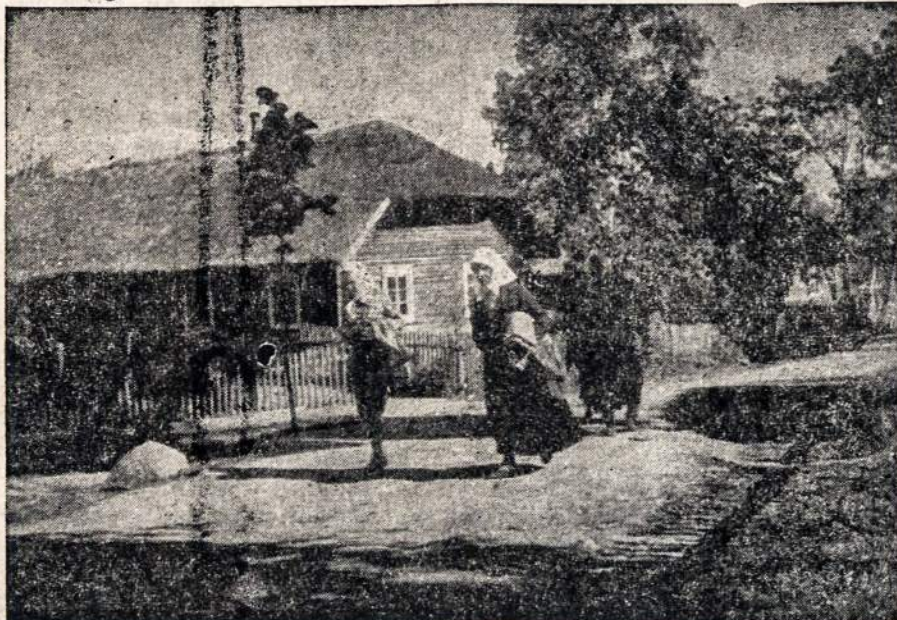
Mes dar grįšim į gimtąjį sodžiu.

Pietų Afrikos valstybė išsiųstė iš mažos olandų kolonijos įsteigtos 1652 metais. Mat Olandijos pirkliai, važiuodami apink Afriką į Aziją arba grįždami namo, norėdavo pakeičiui papildyti maisto atsargas ir apgaudami jo iš vietinių negrų nutarė įsteigti Afrikoje tarsi kokią užkandinę. Kadaigi ten žemė buvo gana derlinga toji kolonija greitai praturbėjo ir patraukė į save daugiau kolonistų. Jūrininkai ją labai pamėgo ir praminė Vandenynų Smukle.