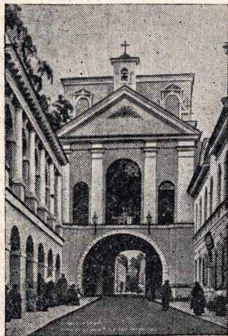
Aušros Vartai Vilniuje.