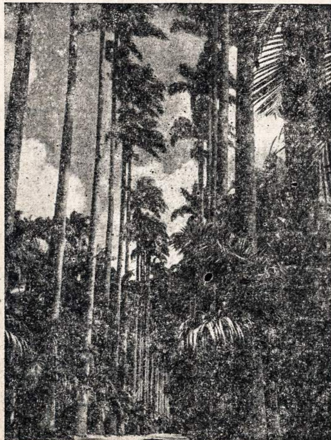
Vienas iš Brazilijos gražių vaizdelių.

O mundo não se ergue destruindo isso ou aquilo, mas, o mundo se ergue construindo isso e aquilo.