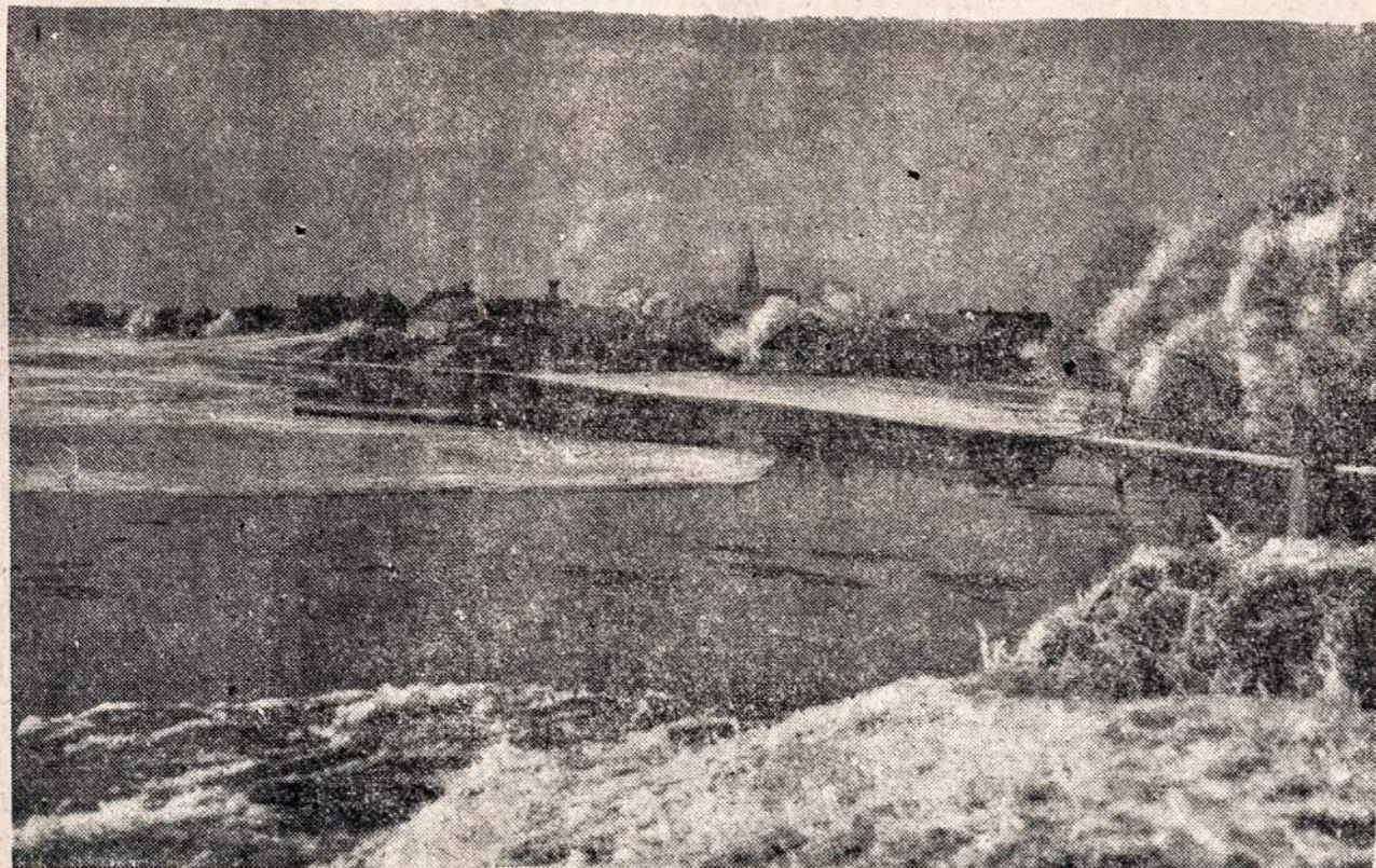
Žavingas Lietuvos vaizdelis