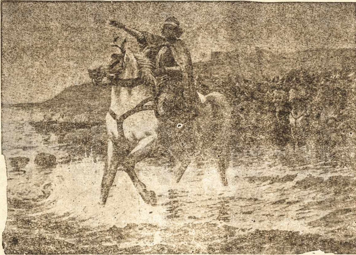
Ar ne didinga Lietuvos praeitis? Vytautas Didysis prie Juodųjų marių: