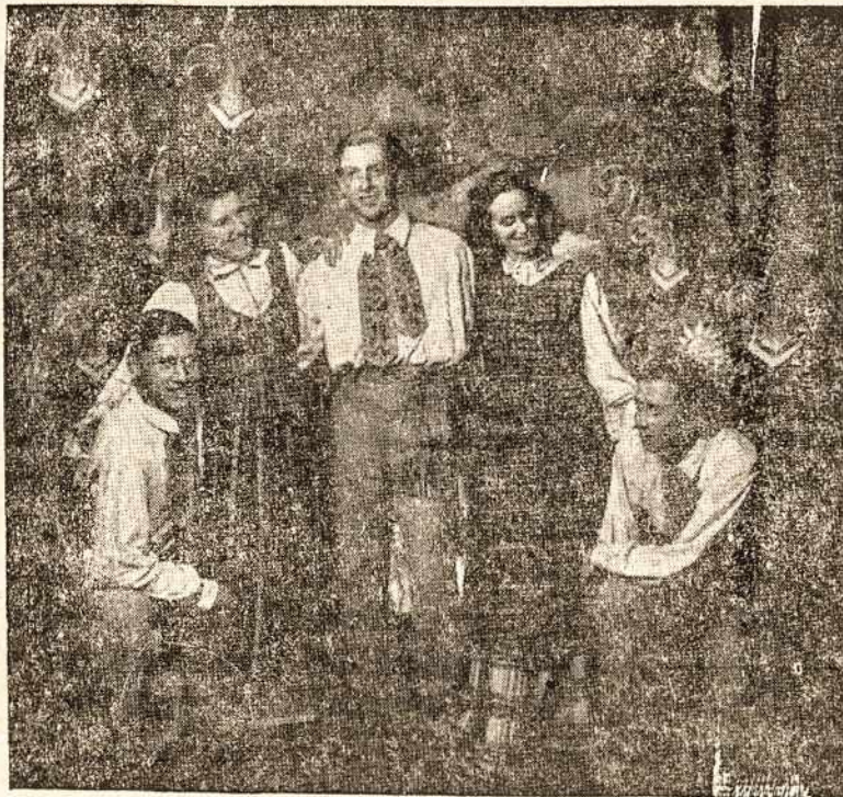
Čia matome Vokietijoje veikiančio «Lietyno» ansamblių.

kusi omis. Būna laužų, linksmavakarių, šokių. Ir čia visi lygūs draugai, be ypatingų išskirčių. Poromis dar niekas neina ir savo «širdies draugų» nerod. Duryš atviros vis ems Vaidina, kas ką turi parengęs arba sukuria «ant greitųjų». Šoka pasikeisdami. Tave veda ne vienas ir tau leidžia pasirinkti ne vieną. Kartais pasirenki «aklai» — prie ko atsigręži. Organizuotos pramo-