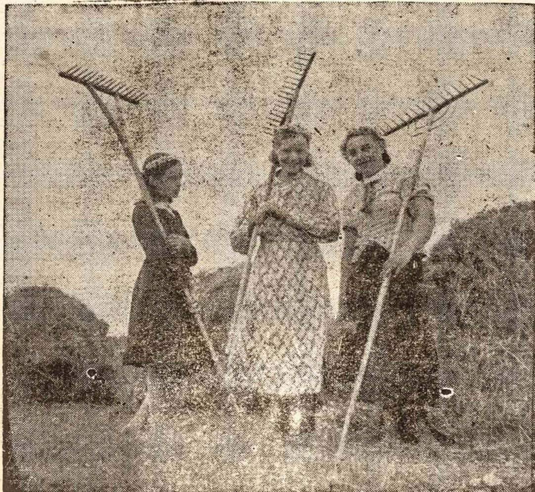
Laisvoj Lietuvoj linksmos grebėjos