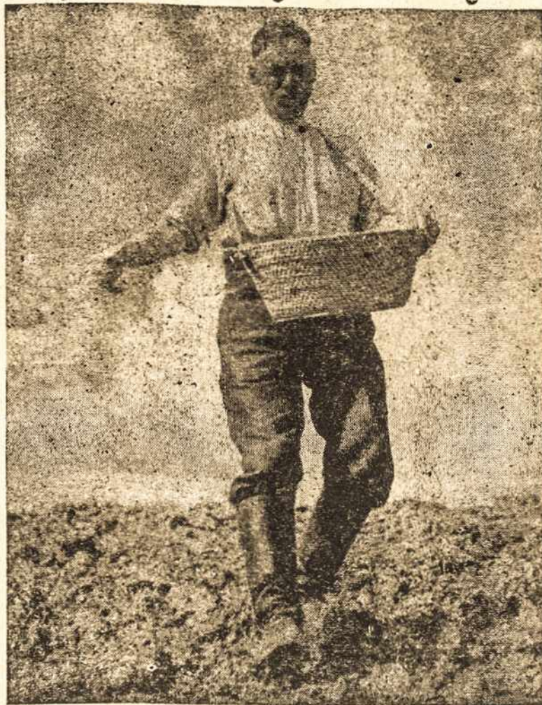
Laisvoji Lietuvoje pavasarį ūkininkas apsidavo savo laukus

Vyriausias Lietuvos Išlaisvinimo Komitetas prašo viso pasaulio lietuvius priminti savo kraštų vyriausybėms ir višumenei pavergtąją Lietuvą ir prašyti jų pagalbos laisvei laimėti. Tai itin svarbu šventiant 50 metų sukaktį nuo Nepriklausomybės paskelbimo. Tam panaudoti vietos dižiją spaudą ir pažintis su valdžios žmonėmis, rašyti laiškus įtakingiems krašto vyrams kaip tai daro Amerikos lietuvių jaunimo organizacija