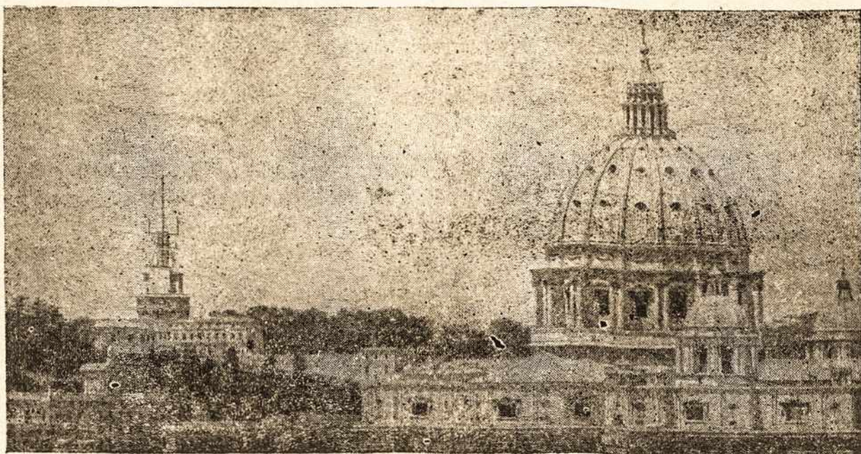
Amerikos Kongreso rūmai

tokiu būdu savo širdies ir dvasios išteklius papildyti būti ai reikalinga skirti laiką ir dvasiniam skaitymui susimastymui pasitarimams. Tikrai pamokos darbas, televizija, kinas, balius ar kitokie pasilinksminimai bei pramogos labai išdžiiovina žmogaus dvasią. Širdį ir jį padaro negailęstingu žmonių jos mašinos rateliu.