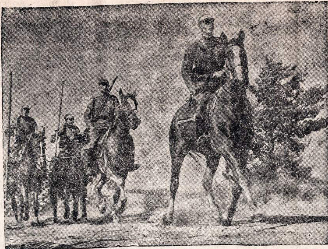
Juodberiai galvas aukštyn...