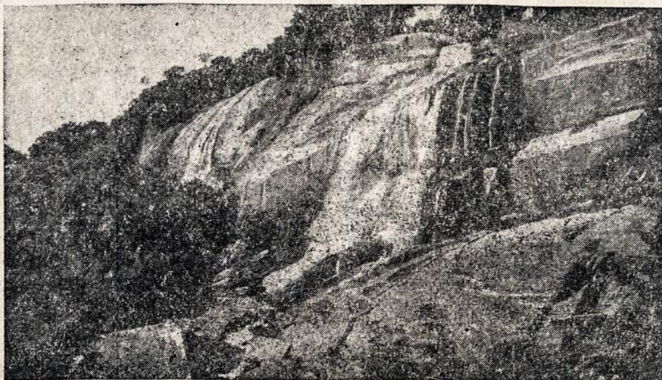
Vienas iš gražių Brazilijos vaizdų