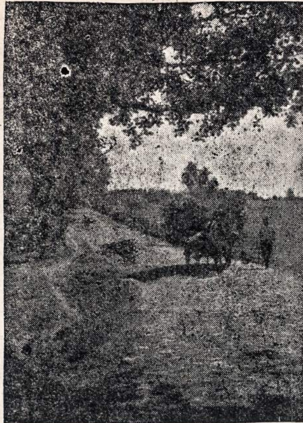
Vienas iš daugelio gražių Lietuvos aiz eliu

Bet ar ne dažniausiai atsitinka taip, kad publikos jau pilna salė ir beateis vienas kitas atsilikėtis, o programa vistiek nepradedama. Žmonės nerimsta, nuobodžiauja. Programos žiūrėti pradeda sugadinta nuotaika, todėl mažiau ploja. Kitą kartą visa eilė