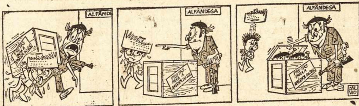
Castro dovanos Brazilijai.