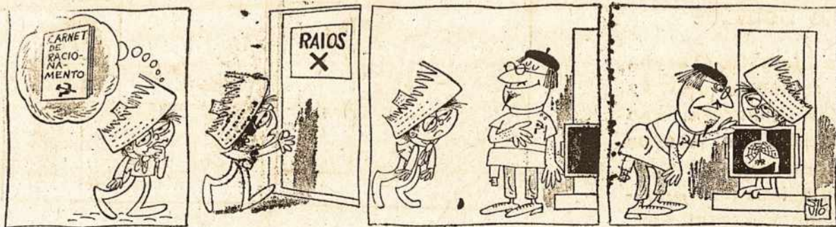
Pilvo voratinkliai — kai nėra ko valgyti komunistų rojuje.