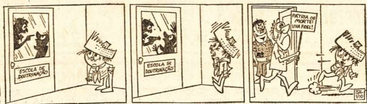
Dom Pedrito nuotykiai.