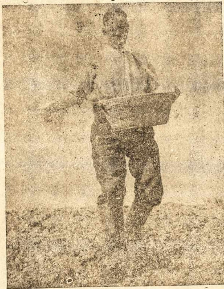
Lietuvos ūkiniakas sėja

METALÚRGICA — FABRICAÇÃO DE PEÇAS PARA AUTOMÓVEIS ESTAMPAS, PEÇAS ÉSTAMPADAS E FERRAMENTAS Praça Padre Lourenço Barendes, 243 — Quinta das Paneiras — V. Prudente Caixa Postal 371 — São Paulo