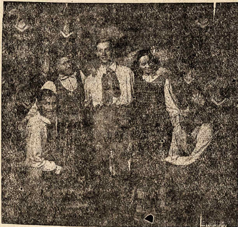
Čia matome Vokietijoje veikiančio «Sietyno» ansamblio grupę