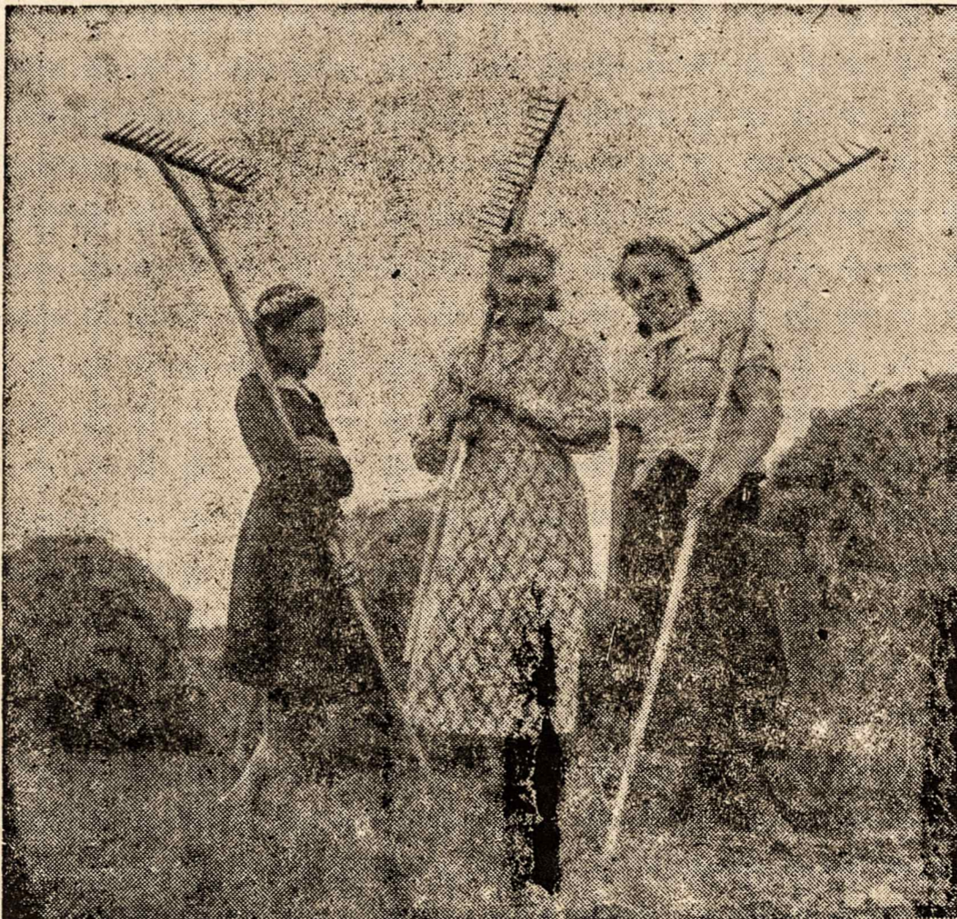
Linksmas Lietuvos jaunimas.

Nemaža chorui progresuoti trukdo jo elementų keitimasis. Tas keitimasis yra naturalus reiškinys, tačiau pas mus jis yra per dažnas. Kitur, kur choros su daro vyresni asmenys, choro sąstatas yra daug pastovesnis. O mūsų choruose yra įsiaknijusi yda chorą lankyti tik iki vedybu. Vėdę choristai chorą palieka ir retai vėliau begrižta. Tuo atveju, kai choro elementai nuolat keičiasi, kai prajavinti choristai išeina, o jų vieton ateina nauji dar netreniruoti — didesnė choro pažanganegali būti įmanoma. Savo laiku choras (pabaiga 5 pusl.)