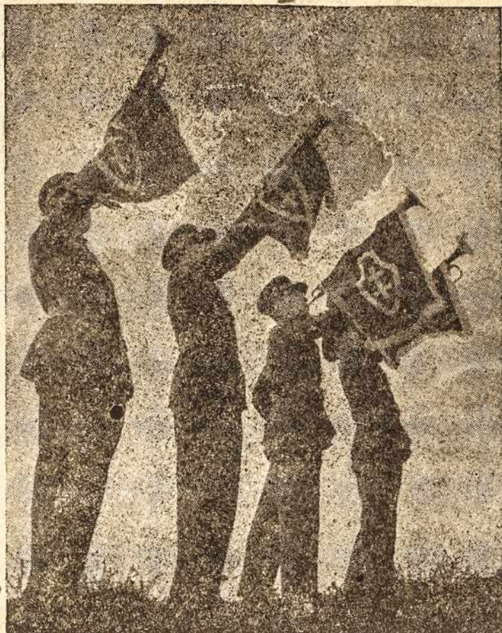
Lietuvos karo invalidai muziejaus sodnelyje Kaune