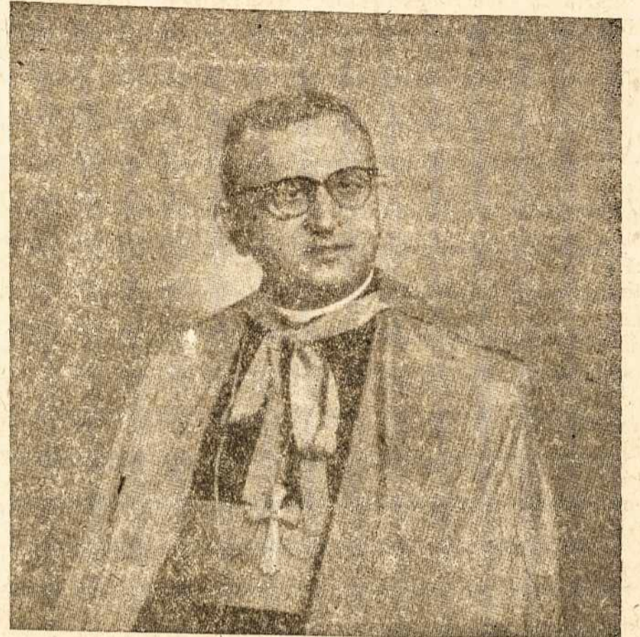
JO EMINENCIJA KARDINOLAS AGNELO ROSSI lietuviškos parapijos įkūrėjas S. Paulo arkivyskupijoje.