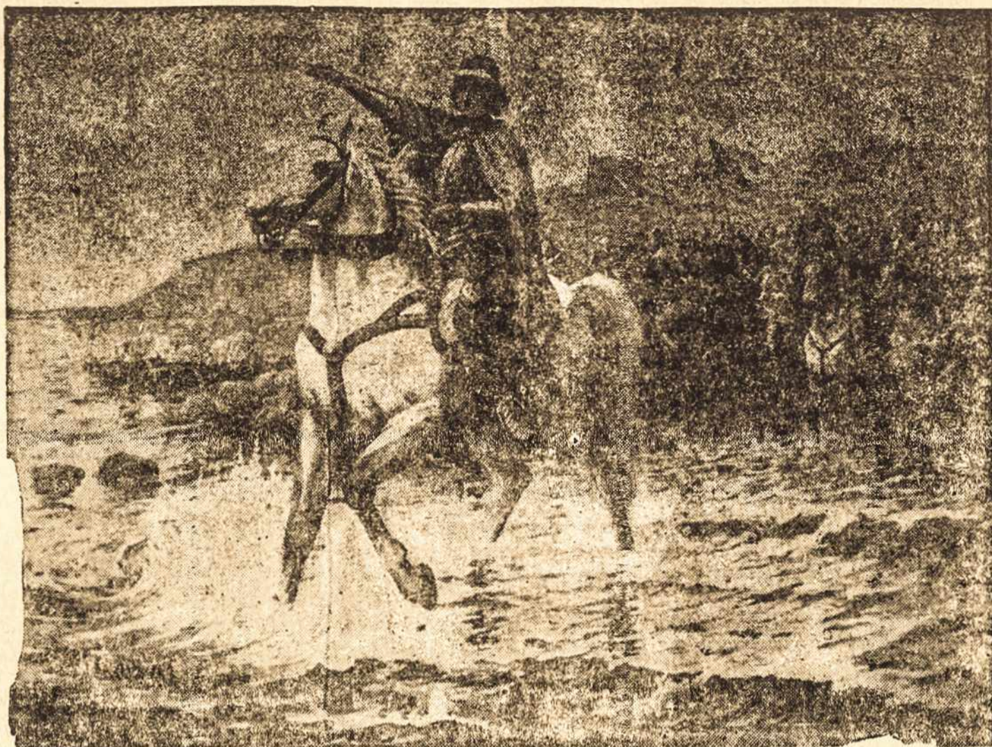
Ar ne didinga Lietuvos praeitis? Vytautas Didysis prie Juodųjų marių

Sekančioje pastraipoje «Tiesa» taip rašo apie A. Dubčeką: «Kai Čekoslovakijos Komunistų partijos pirmasis vadžiavimas davė nurodymus kurti darbininkų bei žemės ūkio kooperatyvus ir komunas, siekiant prisidėti prie pirmosios pasaulijje socialistinės valstybės statybos, 1925 m. Dubčekų šeima išvyko į Tarybų Sąjungą, kur kartu su