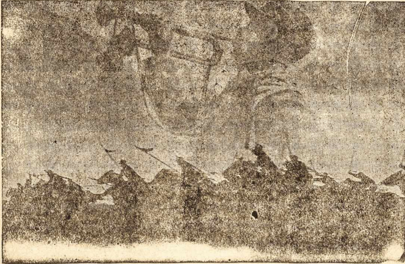
Dar pasaui mus kovos trimitas | kovą už Lietuvos laisvę