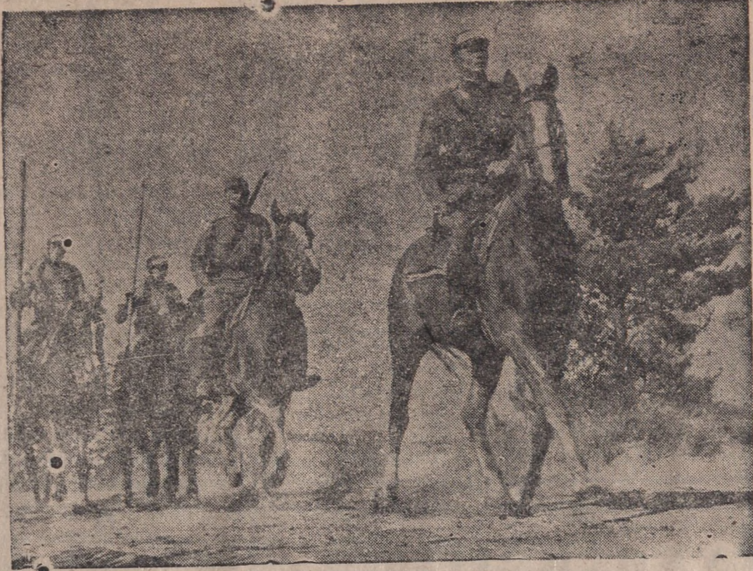
Juodbėriai galvas aukštyn!...