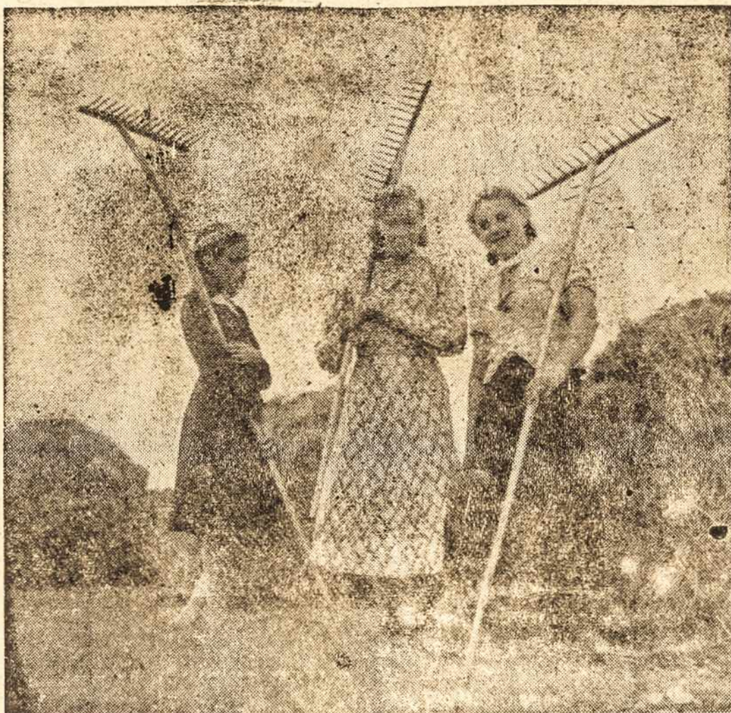
Laisvos Lietuvos laikais linksmos jaunos grebėjos

Matyt, kad kalbos apie suvarymą į kolchozus neaptilo, todėl liepos 12 dieną žemės ūkio ministeris M. Mickis dar kartą bandė nuraminti žmones. Jo kalbą randame «Lie-