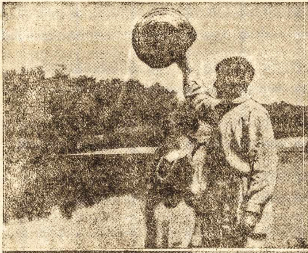
Ten kur Nemunas bangoja...