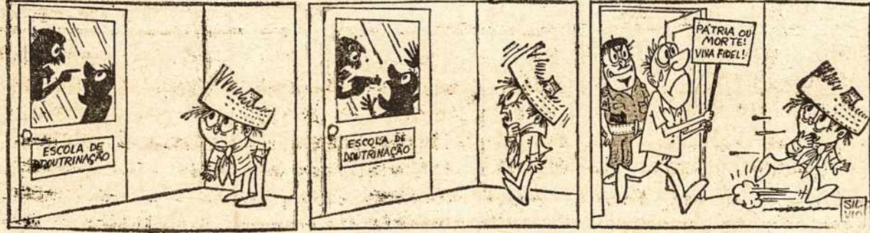
Dom Peito nuotikiai