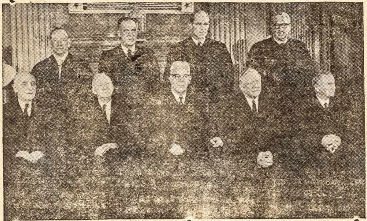
Š. Amerikos aukščiausiojo teismo nariai. Pirmą kartą Amerikos istorijoje vienas jų narys yra juodosios rasės vyras — Thurgood Marshall. Jis stovi antroje eilėje, dešinėje pušėje, paskutinis.

Jau yra gauta šiek tiek aukų iš S. Paulo lietuvių. Dar per mažą. Todėl visi, kas nori tam reikalui savo kad ir ska-