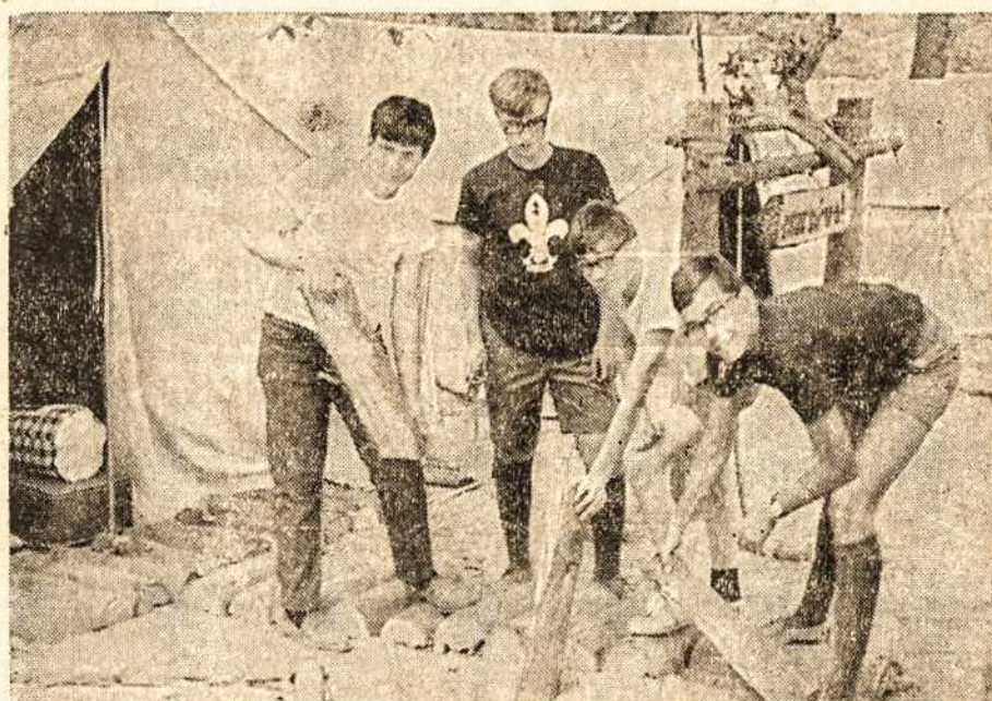
Detroito lietuviai skautai jubiliejinėje stovykloje atlieka stovyklos įrengimo darbus.

4. Jie mus kaltina, kad susirinkimuose nemylime paskaitų. Norime tik linksintis. — Mano tėvai turi daug draugų. Jie vizituoja mus, ir mes einame pas juos. Kai buvome jaunesni, tėvai mus imdavo dėl susidraugavimo su lietuviškais. Dabar aš jau negalėčiau pakęsti tų kompanijų. Ten niekada negali girdėti jokios protingos kalbos. Jie tik kalba, kaip buvo gera gyventi Lietuvoje arba plepalus apie kitus dypu-