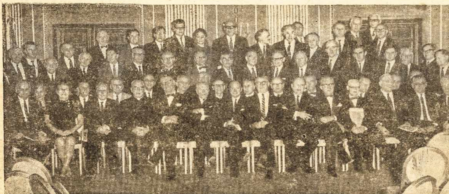
1968 metų gruodžio 7—8 d.d. New Yorke įvykusio Vyriausio Lietuvos Išlaisvinimo Komiteto Seimo Sesijos dalyviai ir svečiai.

NR. 2 (1067) S. PAULO — BRASIL — 1969 M. SAUSIO — JANEIRO 10 D. — XXI METAI