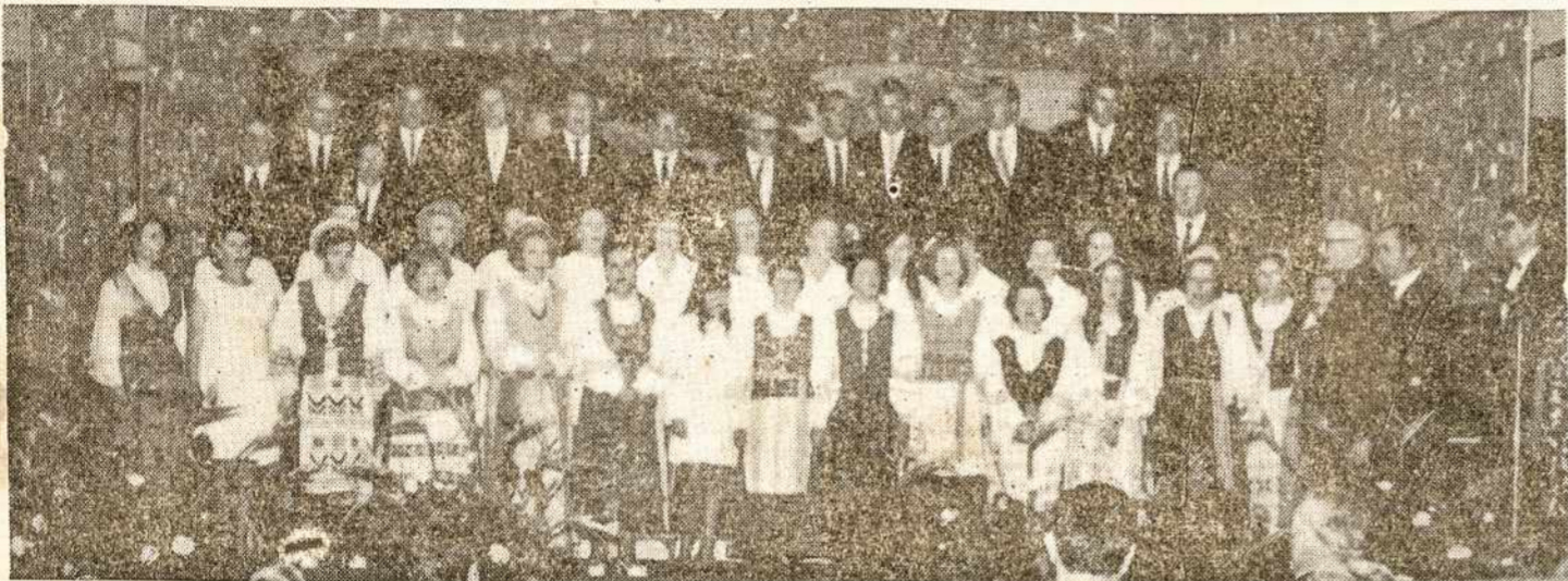
«Aušros» ir Bendruomenės chorai 1970 metais Vasario 16 minėjime.

São Paulo - Brasil - 1970 m. Vasario - Fevereiro 27 d.