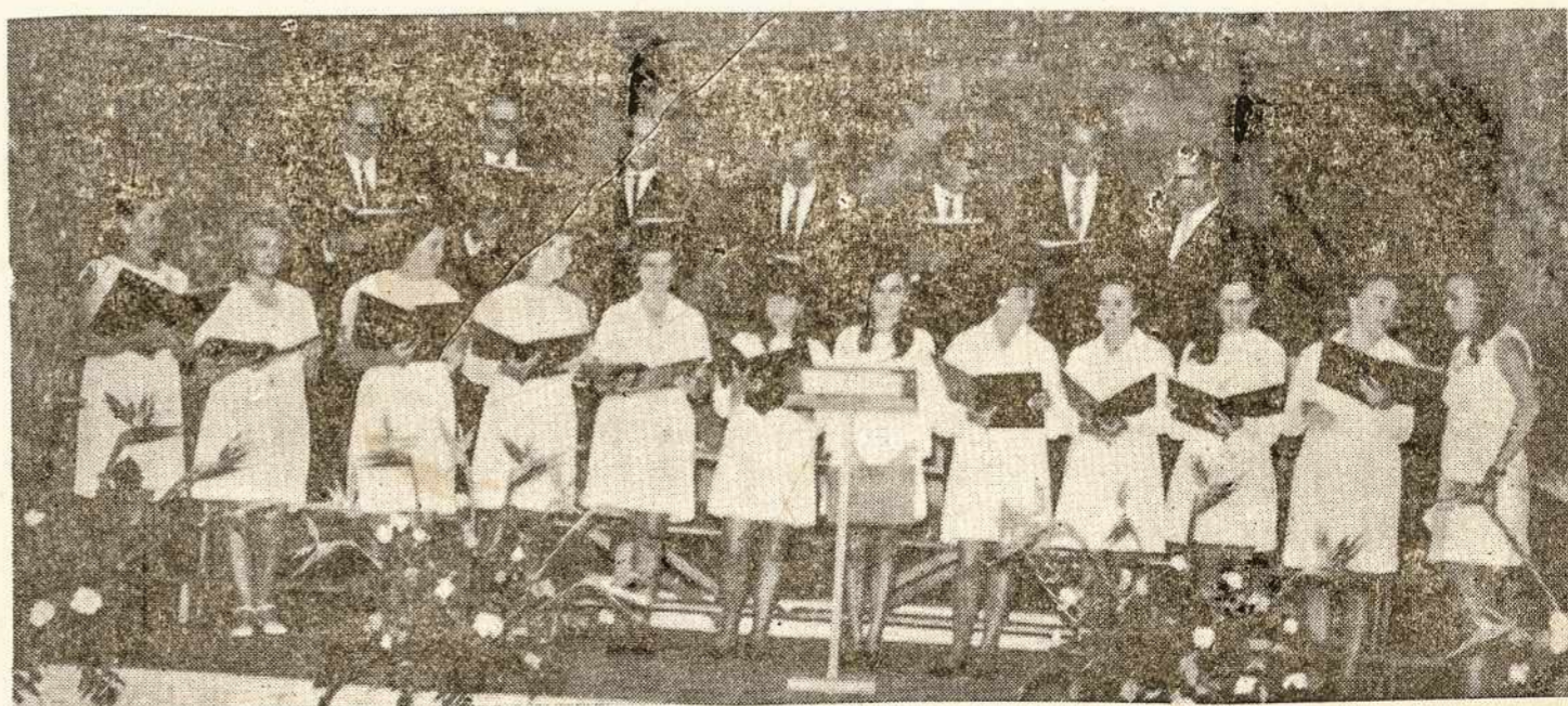
Lietuvių Katalikų Bendruomenės choras 1970 metais Vasario 16 minėjime.

Šiaurės Amerikon vasario 23 dieną atskrido Prancūzijos prezidentas Jurgis Pompidou su dideliu palydovų būriu. Tai yra oficialus valstybės dešimties dienų vizitas. Amerikos žydija, betgi tą kompidou apsilankymą padarė labai neskanų ir nemalonų. Vi suose didžiuosiuose miestuose, kur jis lankysis, rengiamos demonstracijos, mitingai ir juose smerkiamas prezidentas Jurgis Pompidou, už par-