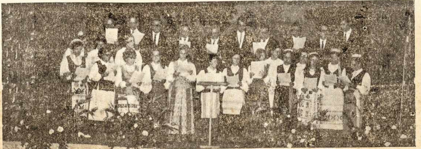
«AUŠROS» choras, dainavęs 2 dainas Vasario 16 minėjime.