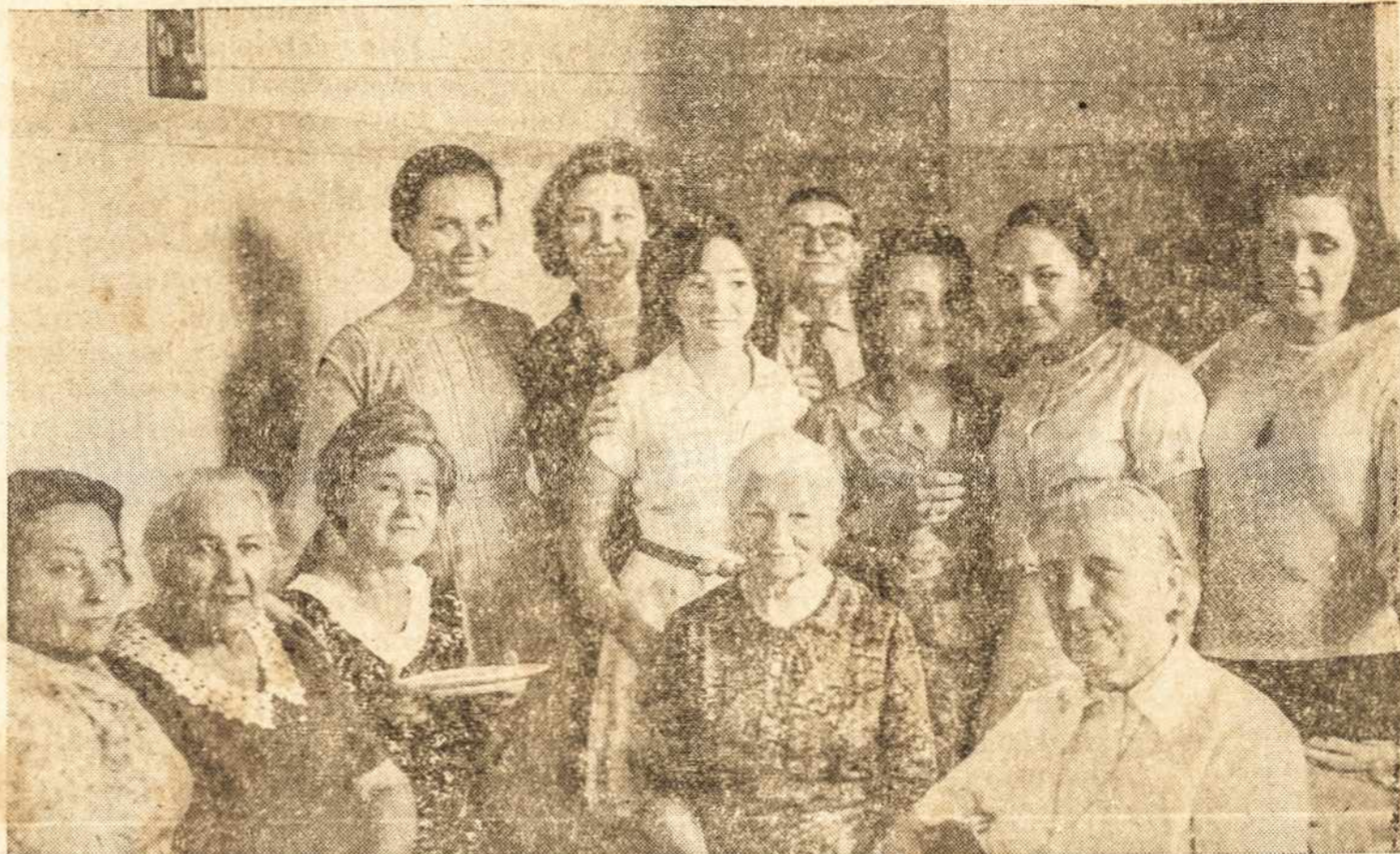
Uoliosios Spaudos Baliaus šeimnininkės. Kas jų nepažįsta?

Patylom, paslapčiom Sovietų Rusija stiprina savo galybę Antilų jūrose, prie pat Pietų Amerikos (ir Brazilijos) pakrančių. Kuboje nuolat lankosi jos kariniai laivai, atveždami daug ginklų, raketų. Šnipai praneša, kad Cienfuegos uoste statomos vietos atominiams povandeniniams laivams sustoti ir taisyti. Šitoks komunistų stiprinimasis Pietų Amerikos pakrantėse atsiduoda rimtu pavojum. Komunistai čia neatvyksta stograšų saulutėje pasišildyti, paatostogauti, ir gerai įsidedinę grįžti namo. Jie čia, be abejo, sustiprina savo bolševikinę propagandą visoje Pietų Amerikoje ir stengsis perversmais ir partizanų karais įvaldyti vietas istatyti komunistų partijas. Tai yra rimtas pavojus Pietų Amerikos demokratijai. Tai sudaro daug rūpesčio tiems, kurie komunistinės valdžios Pietų Amerikoje nenori.