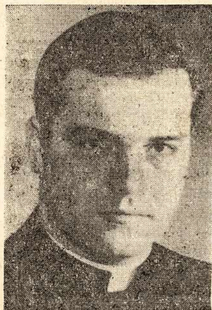
TĖVO ANTANO SKILTIS