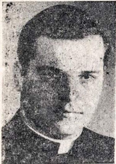
TĒVO ANTANO SKILTIS

MŪSŲ JĖGOS, MŪSŲ ŽINIOS, LAISVAI LIETUVAI TĒVYNEI