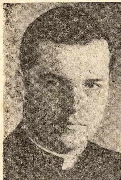
TĒVO ANTANO SKILTIS

MŪSŲ JĖGOS, MŪSŲ ŽINIOS, LAISVAI LIETUVAI TĒVYNEI