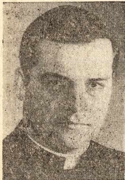
TĒVO ANTANO SKILTIS

Šiame piešinyje rate yra skaičius 9. Visos kitos vietos A, B, C, D, E, F, yra tuščios. Duodami šie skaičiai: 3, 4, 5, 6, 7, 8. Įstatyk šiuos skaičius tuščiose vietose taip, kad skaičiuodamas A-9-D, F-9-C ir E-9-D gautumei kiek vieną kartą po 20.