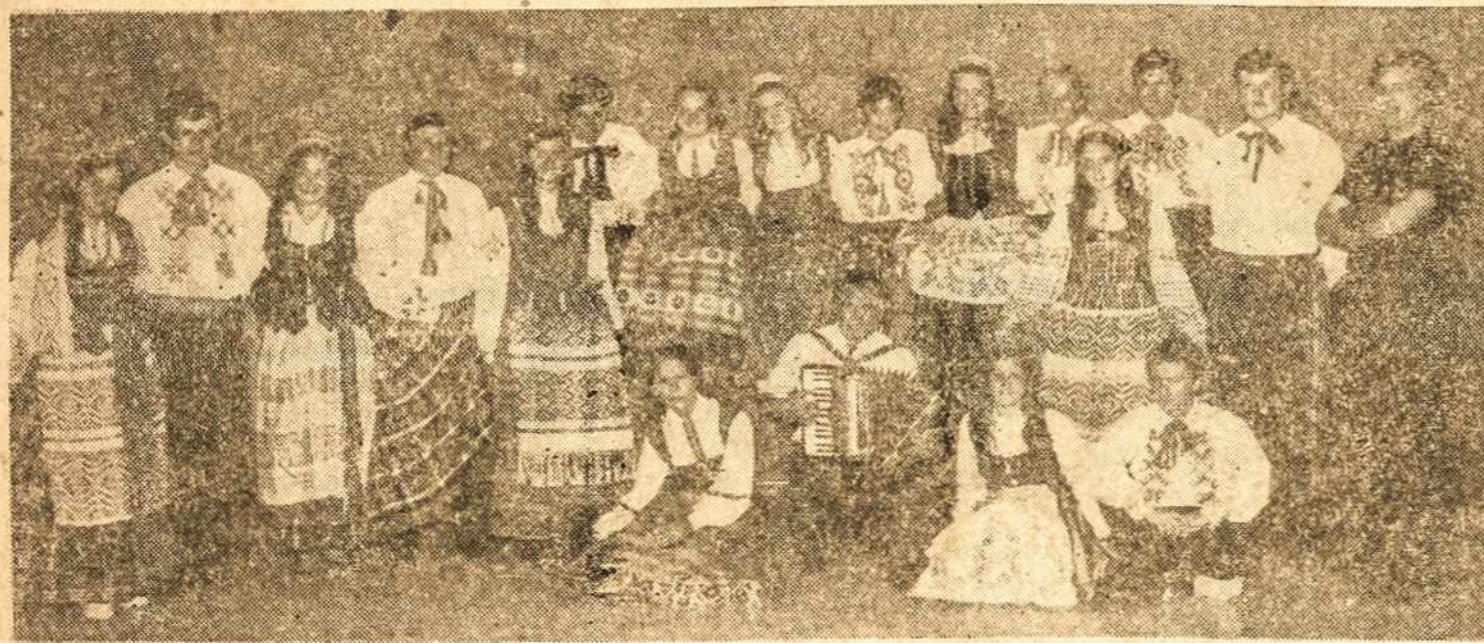
Štai dalis urugvajiečių AŽUOLYNO, kurs sausio 17 ir 24 dienomis žavės mus savo grakščiais šokiais! Būtinai ateikite pasižiūrėti. Pamatysite, ko iki šiol dar nematėte!