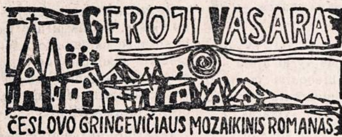
ČESLOVO GRINCEVIČIAUS MOZAIKINIS ROMANAS

Vilnuje atidaryta paroda „Vilnius prieš 150 metų“, kurioje yra anų laikų paveikslų ir litografijų. Arti šimto tūkstančių lankytojų aplankė neseniai pasibaigusią senų Lietuvos pinigų parodą.