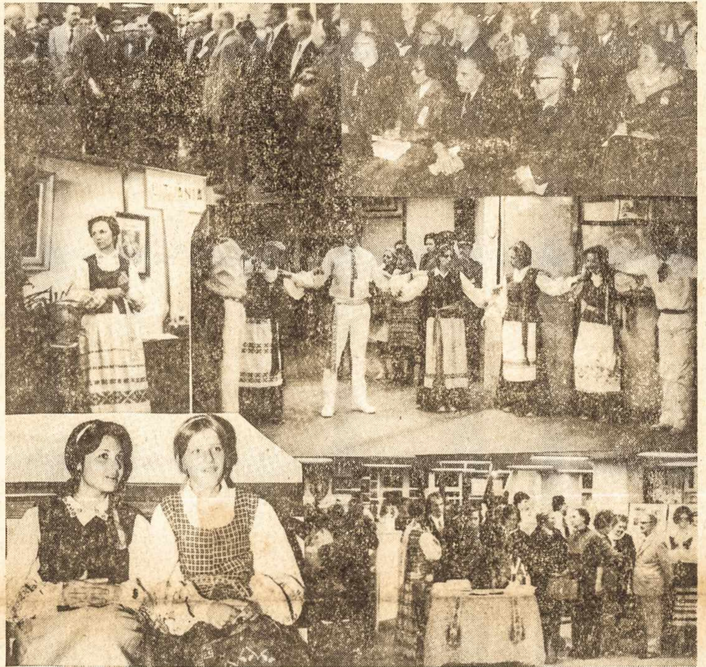
1971 METŲ BALTŲ SAVAITĖ SÃO PAULYJE.

Brazilijos Respublikos prezidentas gen. Medici praeitą savaitę paskelbė dekretą-įstatymą apie Šiaurės Rytų (Nordeste) ūkinį pagerinimą ir pakėimą. Tai labai platus didingas Brazilijos Vyriausybės planas praveisti reikiamas žemės reformas, žemdirbystės ir gyvulininkystės pagerinimą. Tam planui per 4 metus bus paskirta 5 milijonai kruzeirų, čia įeina ir pramonės bei prekybos išplėtimas.