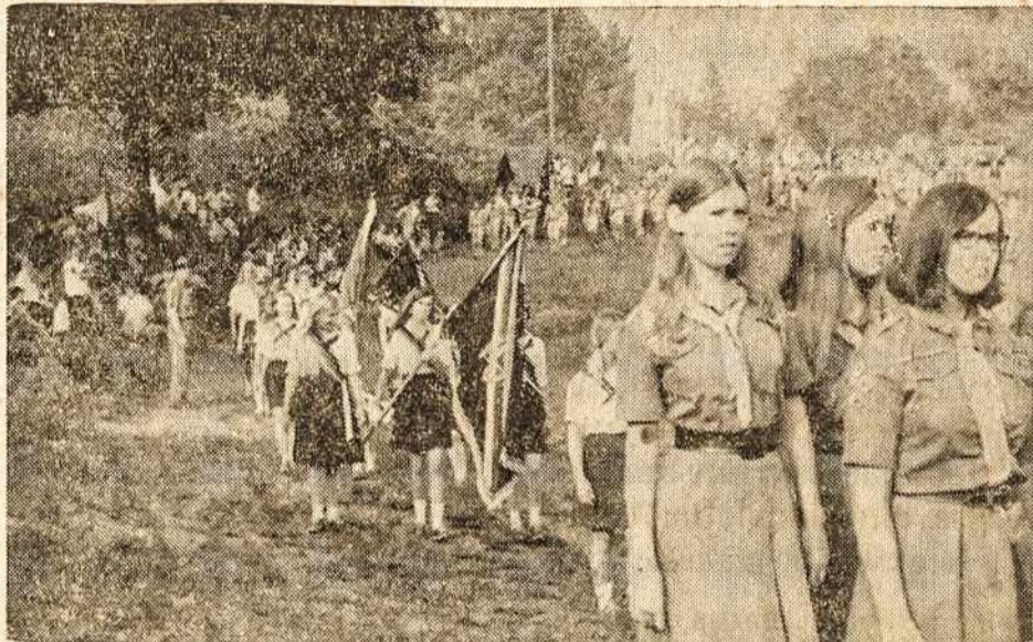
Taip žygiuos mūsų jaunimas savo kongrese teinančiais metais.

S. PAULO — BRASIL — 1971 m. lapkričio — novembro 5 d.