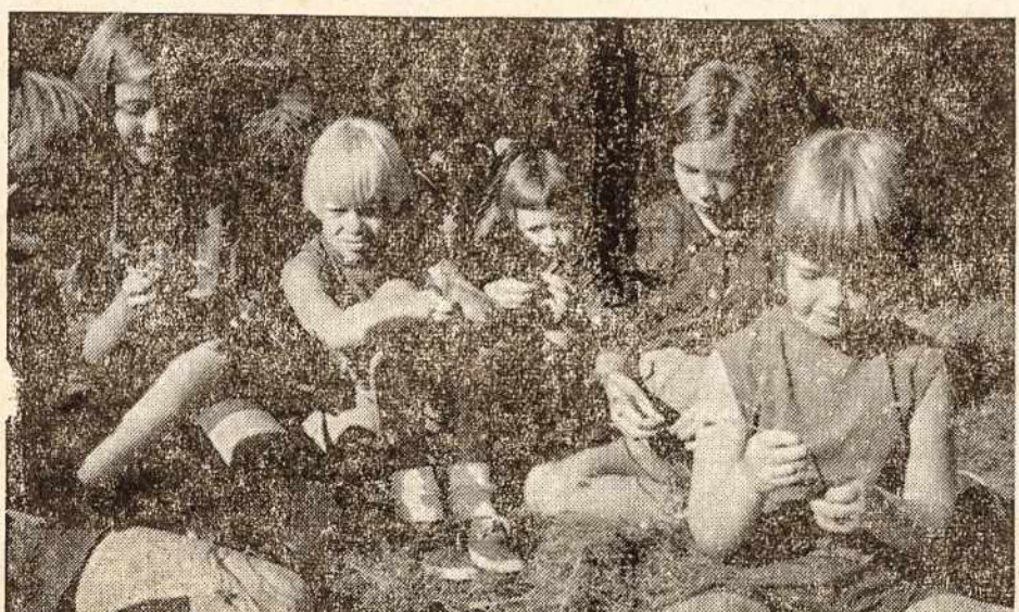
Drauge ir darbeliai malonesni!

Arkiv. Jurgio Matulaičio gyvenimas ir darbai, krikščioniška kantrybė ir ištvėrmė siekimuose, artimo meilė ir pasiaukojimas krikščioniškiems idealams yra tikrai viena jo gyvenimo žymė, neišnykusi ir šiandien. Jo pėdomis seka jo sukurtų ar reformuotų vienuolių ariai, jo pavyzdžiu gali sekti ir šio meto kiekvienas krikščionis savo aplinkoj, nes jo gyvenimo laisvė ir dar pulsuoja visišku šviežumu. To, ką jis anuo metu siūlė ir šio siekė, ko norėjo, krikščioniškas pasaulis tebesiekia dar ir šiandien. O kai kuriems kraštams dar reikės dešimtmečių, kol pajėgs pasiekti geresnių vasių socialinio teisingumo srityje.