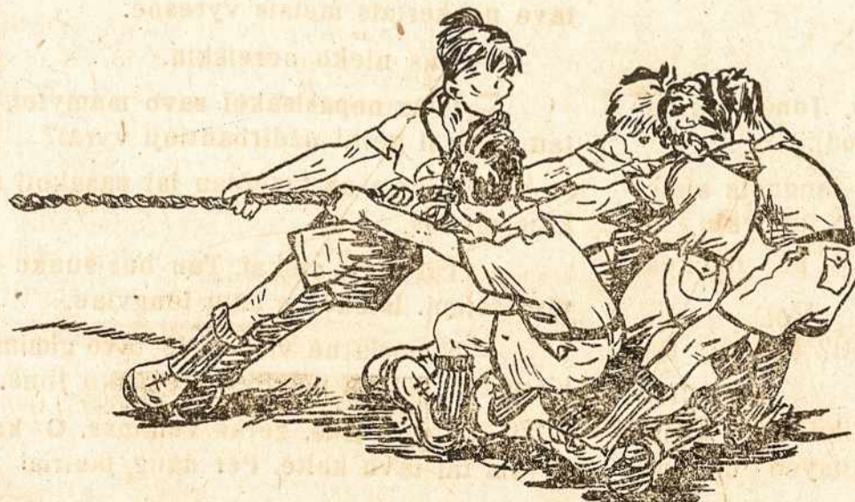
Stovykloje jaūnimėlis išbandys savo jėgas!

Labai įsitempė Indijos ir Pakistano santykiai. Sutraukta daug kariuomenės prie sienos abiejų pusių. Jau įvykę smarkokų susišaudimų. Boma si, jog kas valandą galys kilti tikras tų kraštų karas.